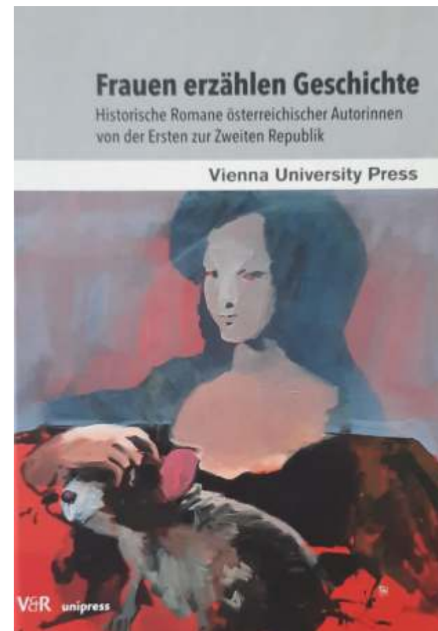
Dama z pupilem, 2019