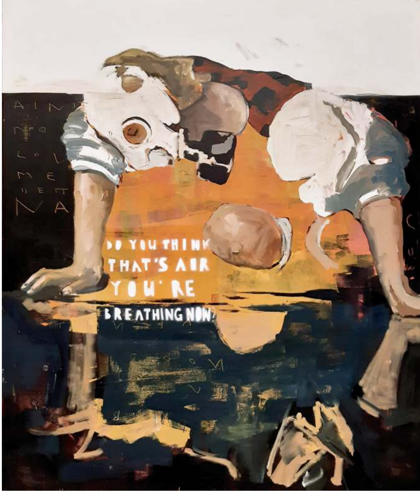
Do you think... 2 0 1 9 olej na płótnie 120 x 140 cm [Caravaggio]